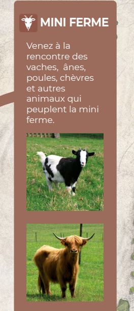
illustration : Anthony Rumeau